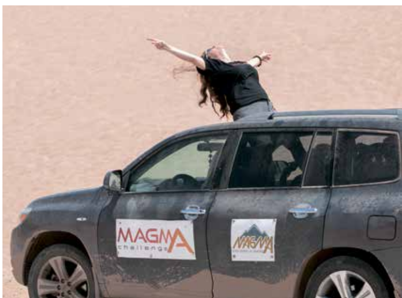
נוכרתי כמה הטבע טוב לי בנשמה

הייתי שמונה ימים בחברת נשים: בג'יפ, באוהל, במלון, בארוחות הכי במלון, בארוחות הכי נפלאות בעולם שהוכנו באמצע השטח, בנופים הכי יפים שראיתי, בדרכי העפר, במסלול שנתפר במיוחד בשבילנו וכל רגע ורגע בו תוכנן בקפידה ובאהבה