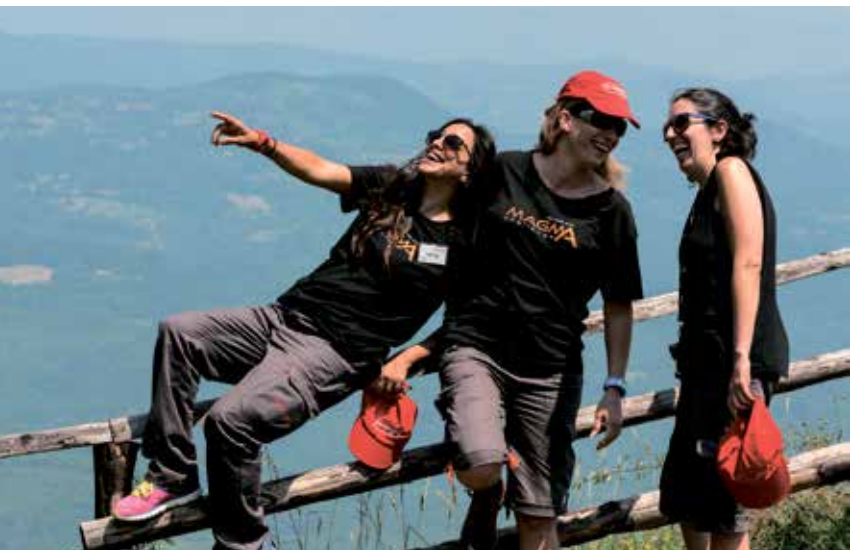
בסוף הן הרווחו הכי גדול שלי מהמסע