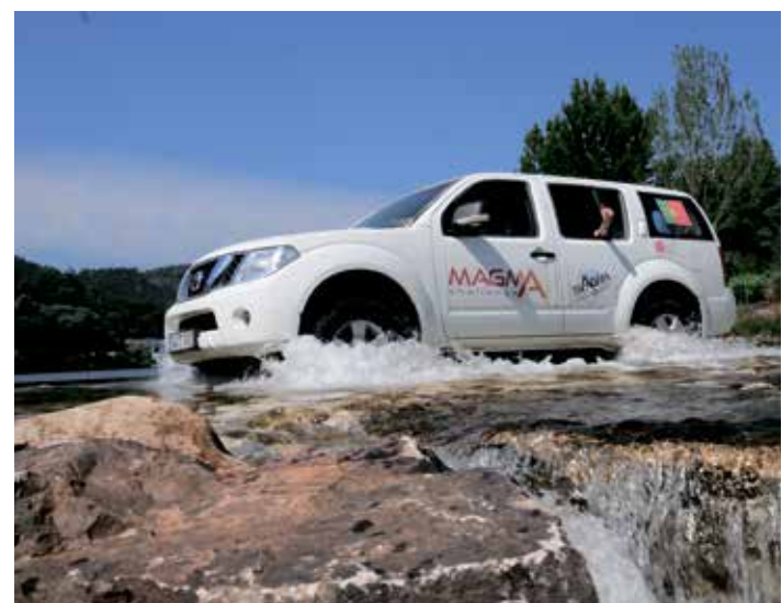
מסע שכל רגע ורגע בו נתפר באהבה

הייתי שמונה ימים בחברת נשים: בג'יפ, באוהל, במלון, בארוחות הכי במלון, בארוחות הכי נפלאות בעולם שהוכנו באמצע השטח, בנופים הכי יפים שראיתי, בדרכי העפר, במסלול שנתפר במיוחד בשבילנו וכל רגע ורגע בו תוכנן בקפידה ובאהבה