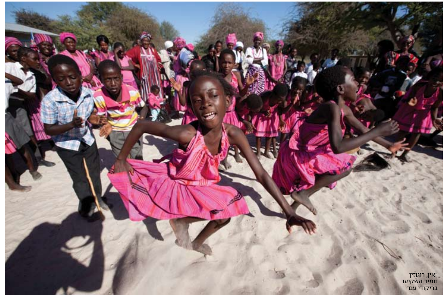
"אין, רוגוזין תמיד השקיעו בריקודי עם"