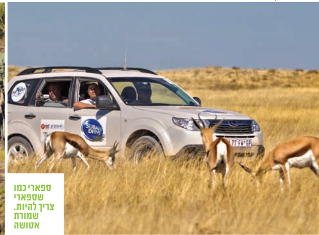
ספארי כמו שספארי צריך להיות. שמורת שמושה אטושה