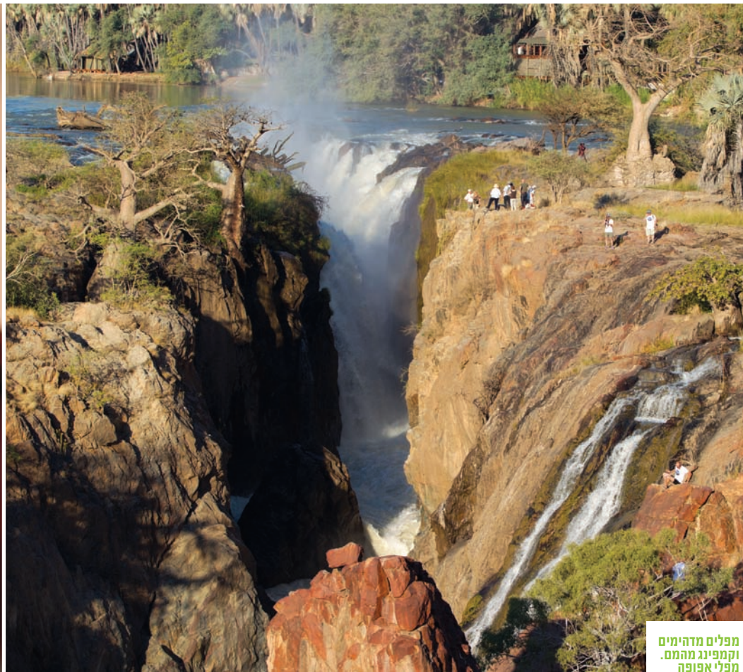
מפלים מדהימים וקמפינג מהמם. מפלי אפופה