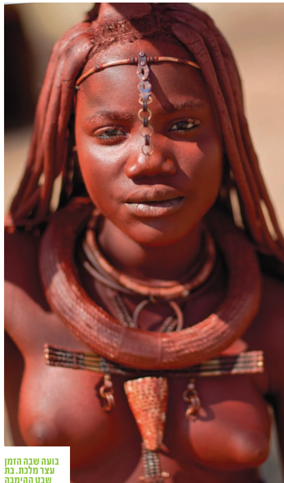
בועה שבה הזמן עצר מלכת. בת שבת ההימנה