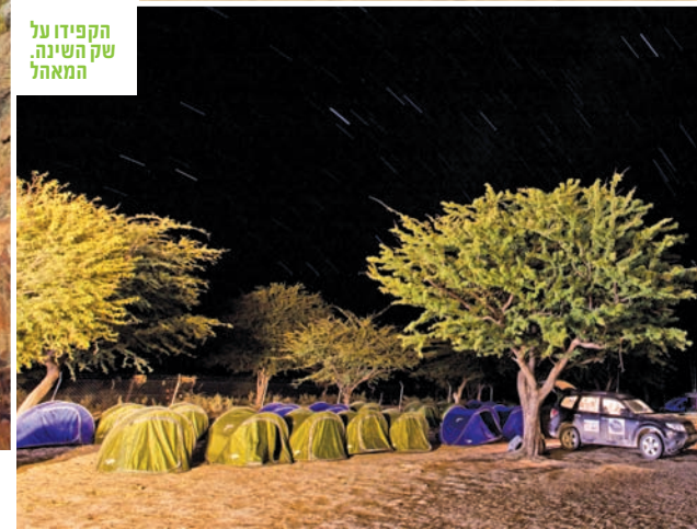
הקפידו על שק השינה המאהל