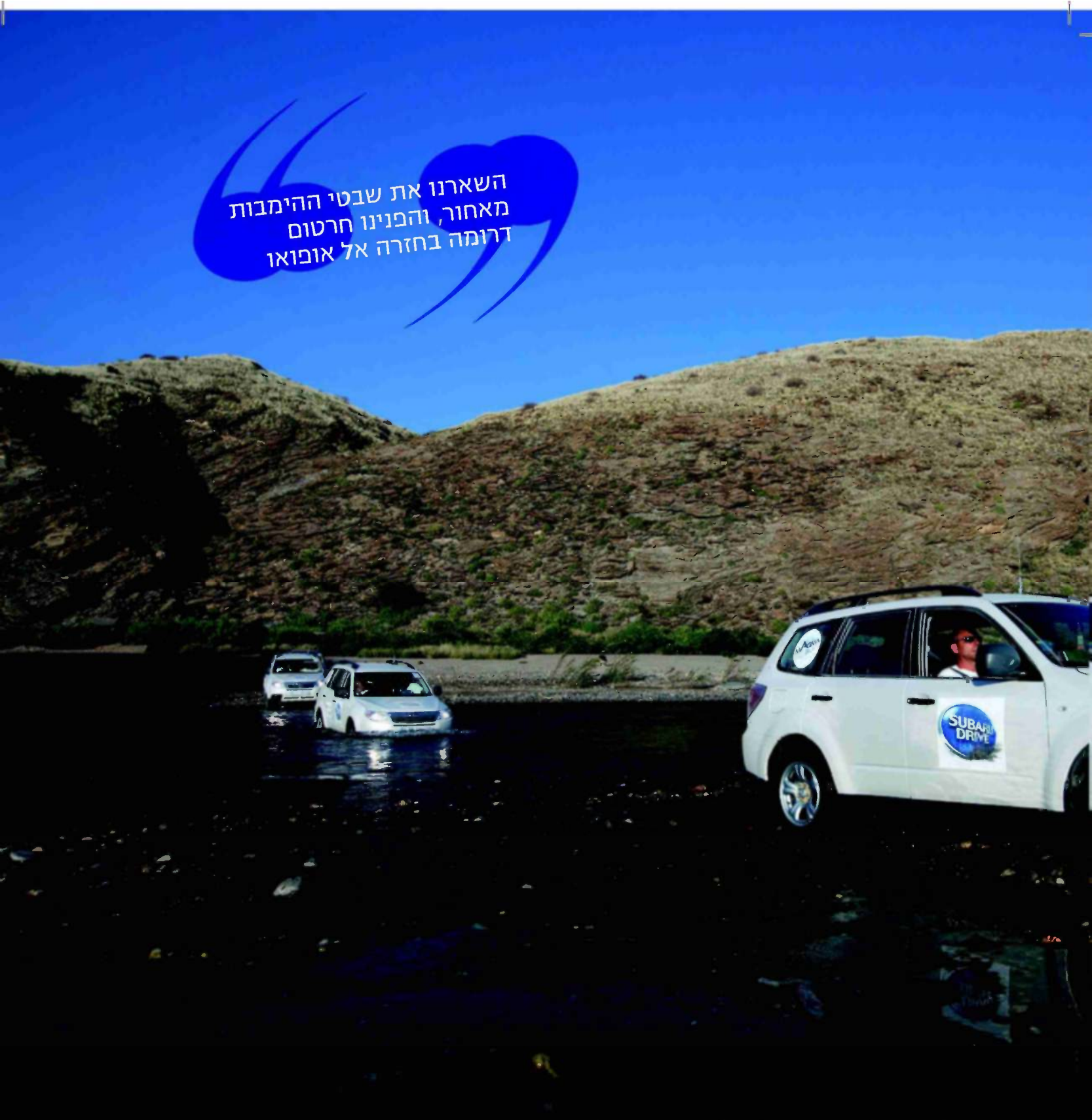
פרט למעבר המים, לא אותגרו הפורסטרים יתר על המידה במתארים טכניים

השארנו את שבטי ההימבות מאחור, והפינו חרטום דרומה בחזרה אל אופואו