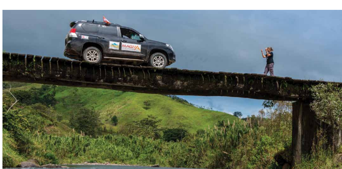
שרון פרנקו מנהלת פרויקט מאגמה צ'אלנג'

"כי זה ממכר. אם את חושבת שתעשי את זה פעם אחת, התשובה היא לא, את תרצי עוד".